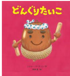
0、1歳児 はな組 「どんぐりだいこ」