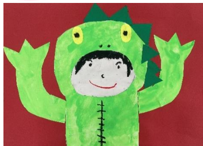
4歳児 そら組 「ぼくがきょうりゅう だったとき」