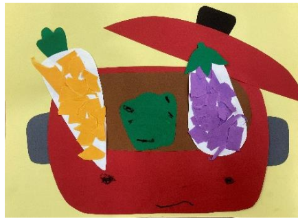
2歳児 ほし組 「ふたを ぱかっ」