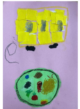
3歳児 おひさま組 「えんそくバス」