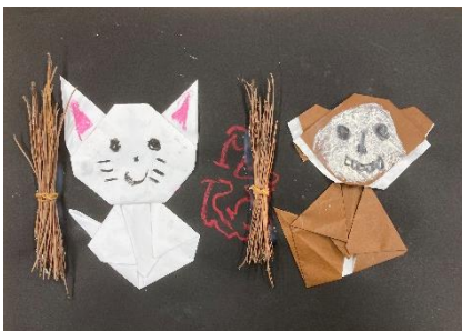
5歳児 にじ組 「かちかちやま」