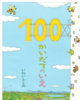
5歳児 にじ組 「100かいたてのいえ」