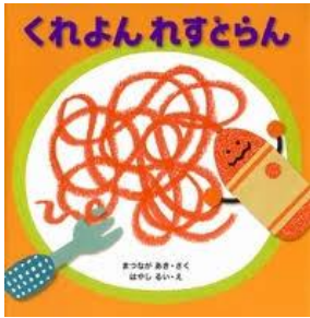
0・1歳児 はな組 「くれよんれすとらん」

めいまいピーノこども園の11月の製作帳をご紹介します。実りの秋に関連し、食べ物の絵本にたくさん触れた子ども達。製作帳から美味しそうな香りがしそうですね。