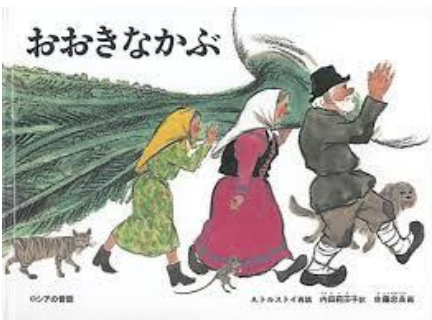
3歳児 おひさま組 「おおきな かぶ」